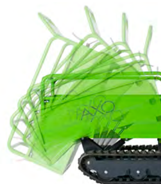
Movimento idraulico per ribaltamento