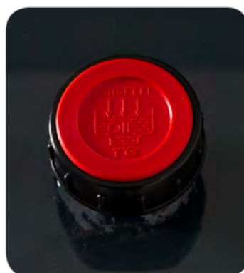
testo descrittivo immagine