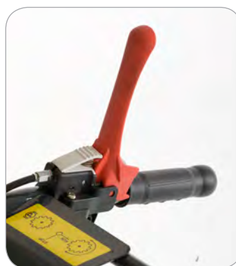
Leva di sicurezza a normativa CE