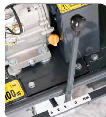
Cambio 4 velocità 3 AV + 1 RM