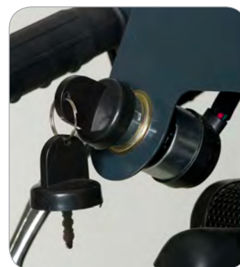
testo descrittivo immagine