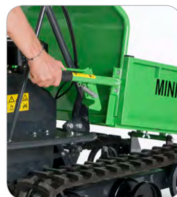
Particolare ribaltamento manuale